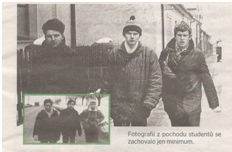
Fotografií z pochodu studentů se zachovalo jen minimum.

Opět nevím, co psát. Rád bych vám řekl nějaká životní moudra, ale vím, že jsou v každém mém vyprávění a zkrátka vás jimi už nudím. Tak raději obraťte list, ať se posuneme zase o kus dál.