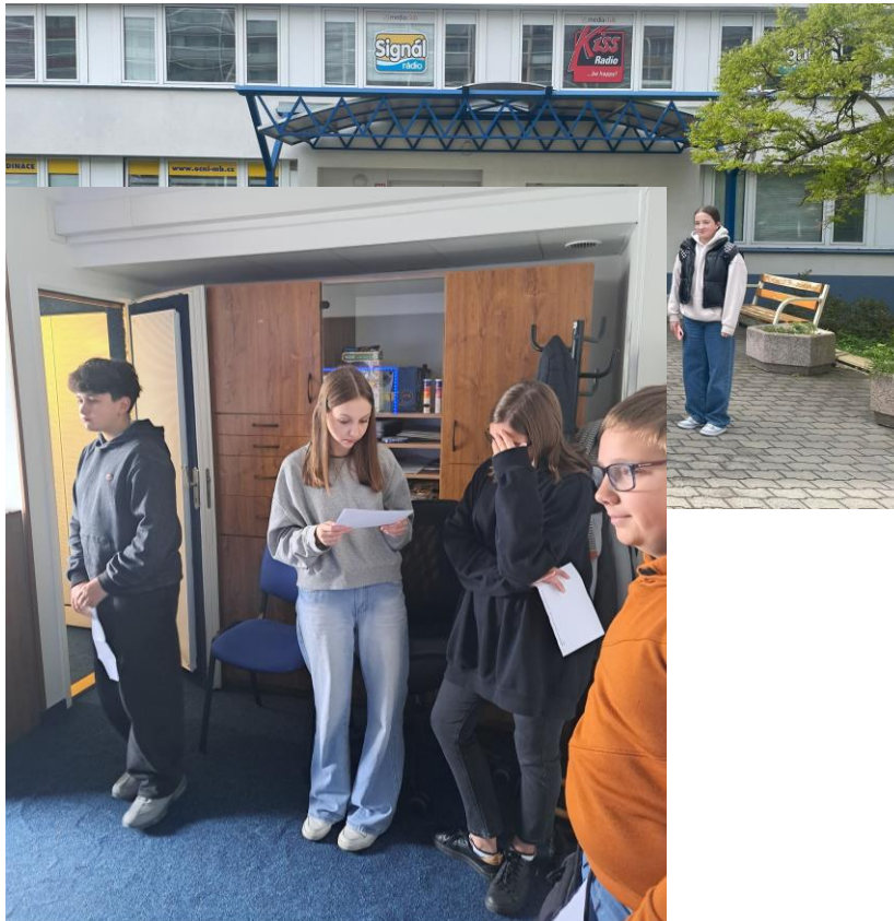
Společná fotka obou týmů před rádiem Signál, 24.4.2024

“Přemýšlejte, dávejte si bacha na to, co vám kdo říká, vy jste generace, která tuhle atmosféru nezažila, přemýšlejte, srovnávejte, naučte se logicky myslet. Naučte se rozeznat tu manipulaci, je jí všude kolem nás plno. A nezaujímejte radikální stanoviska, protože většinou je to kurva blbě.”