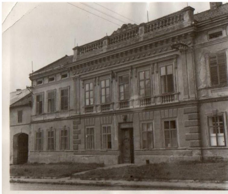
Statek rodiny Nepustilovy.