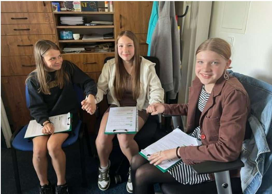
Natáčení audio reportáže v rádiu Signál v Mladé Boleslavi 2. 5. 2024