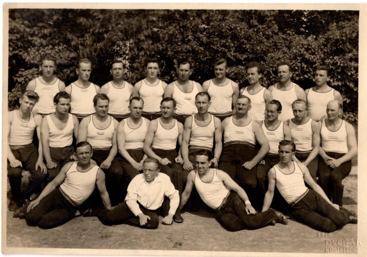
Sokol Byšice muži 1948, p. Sádlo čtvrtý zleva