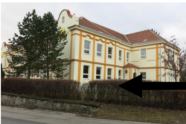
Tělocvična ZŠ a MŠ Byšice

Mělo se stavět, ta sokolovna nebo tělocvična vlastně byl veškerý materiál. Cihly, dříví připravený dole na tom sokolském hřišti, který znáte asi jako sokolské. Tam byly ty cihly poskládaný, jenomže když přišli Němci, tak jednak ten sokol zakázali, ten materiál rozebrali a z toho prej postavili nějaký stodoly tady po okolí. Takže Sokol jako takovej přišel vlastně o ten základní majetek na stavbu tý sokolovny. Bohužel už se to nikdy nedalo dohromady tolik peněz, sil na to aby se obnovila ta tělocvična.