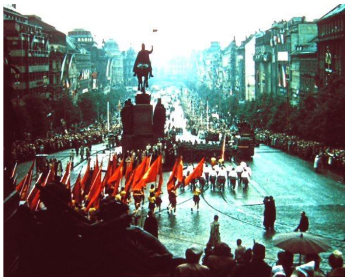
protest sokolů při všesokolském průvodu během sletu v červnu 1948