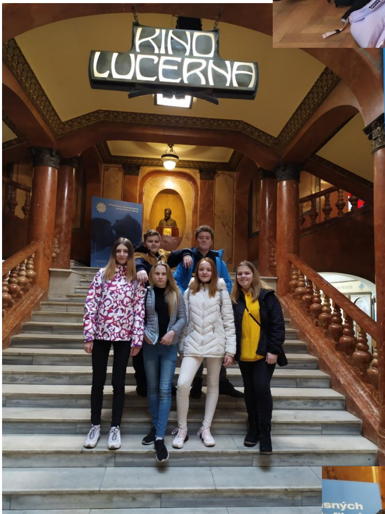
workshop Post Bellum, Lucerna Praha, leden 2020