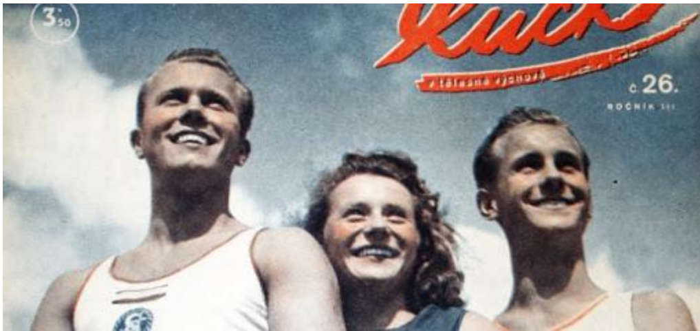
XI. sokolský slet, Praha 1948

XI. slet se konal v červnu 1948 v Praze na Letné. Celá akce byla pod kontrolou komunistických bezpečnostních sil. Svůj vztah ke komunistům dali sokolové najevo zcela jasně ať již provoláváním jmen TGM a E. Beneše či tím, že kolem tribuny s představiteli státu v čele s Klementem Gottwaldem prošli sokolové mlčky s odvrácenými hlavami.