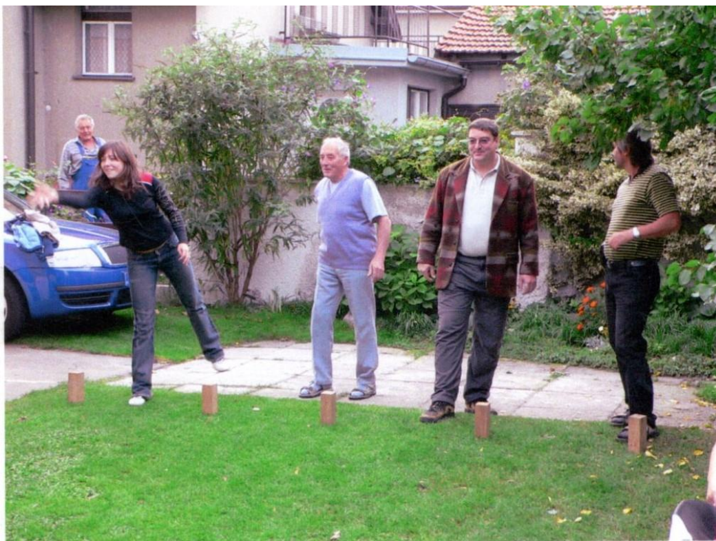
rodinná oslava devadesátých narozenin