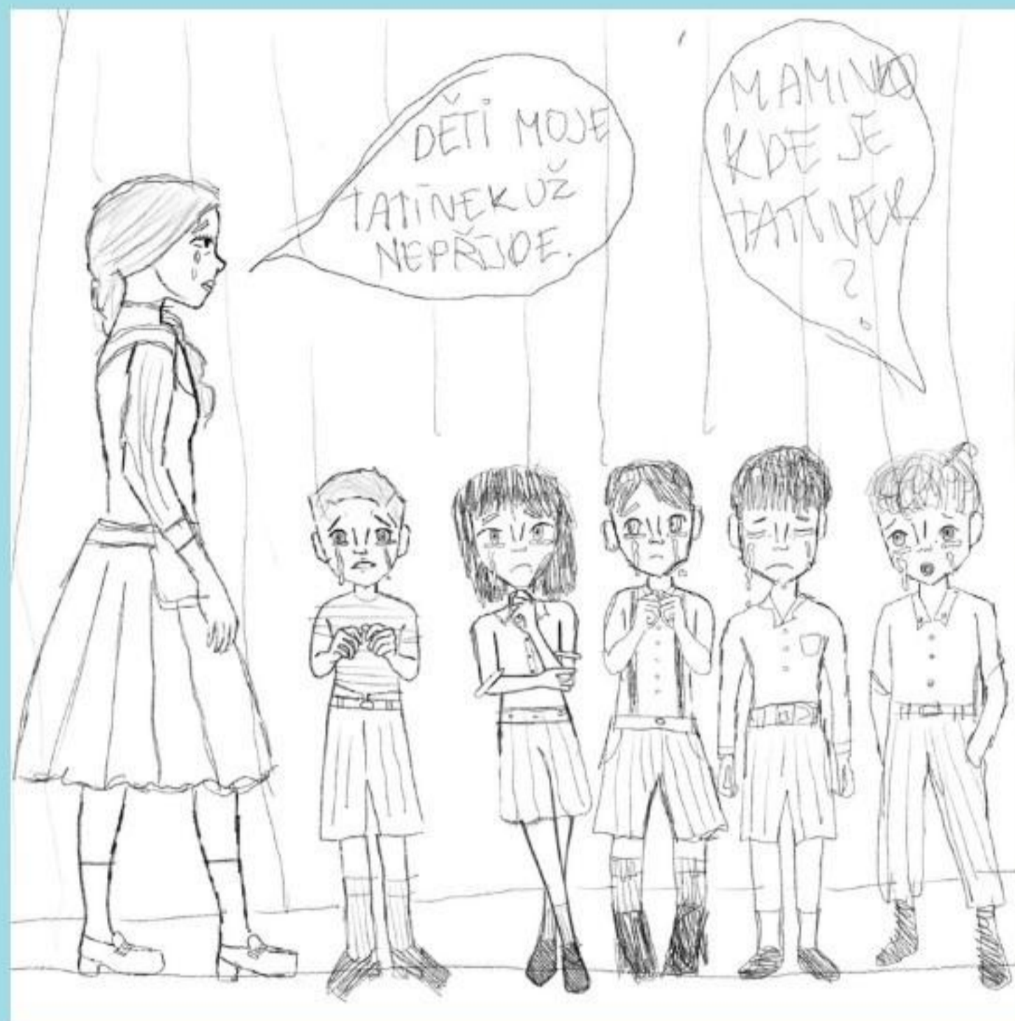
PO TRAGICKÉ SMRTI TATINKA NA KONCI VÁLKY SE RODINA PŘESTĚHOVALA DO LIBERCE.