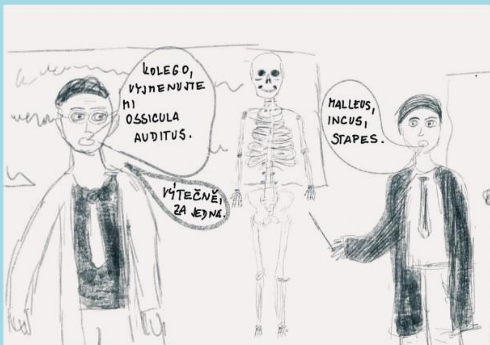
PO MATURITĚ MU PRVNÍ PŘIJÍMACÍ ZKOUŠKY NA MEDICÍNU NEVÝŠLY, DRUHÝ ROK SE JIŽ NA ŠKOLU DO PRAHY DOSTAL A ÚSPĚŠNĚ JI VYSTUDOVAL.