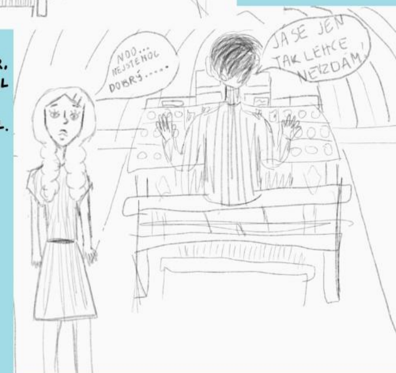
I PŘES POČÁTEČNÍ NEÚSPĚCH SE NEVZDAL, PILNĚ TRÉNOVAL A V UMĚLECKÉ ŠKOLE HRU VYSTUDOVAL NA VARHANY.