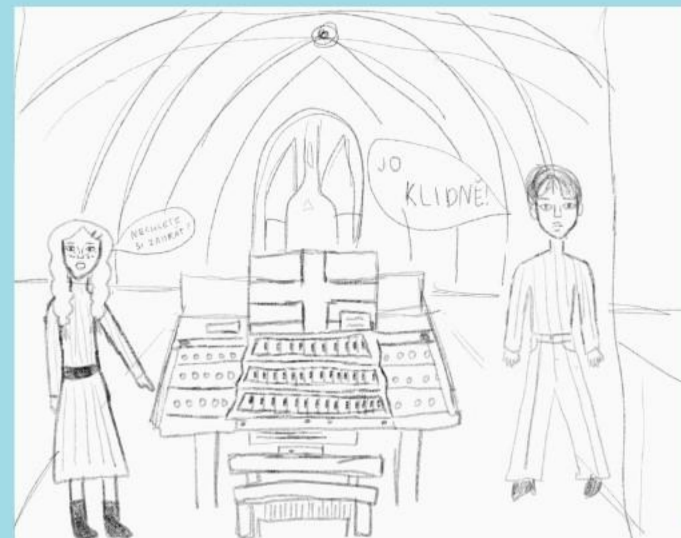
NEJDŘÍVE SE V UMĚLECKÉ ŠKOLE UČIL HRÁT NA KLAVÍR, KDYŽ ALE V KOSTELE DOSTAL MOŽNOST HRÁT NA VARHANY, RÁD TOHO VYUŽIL.