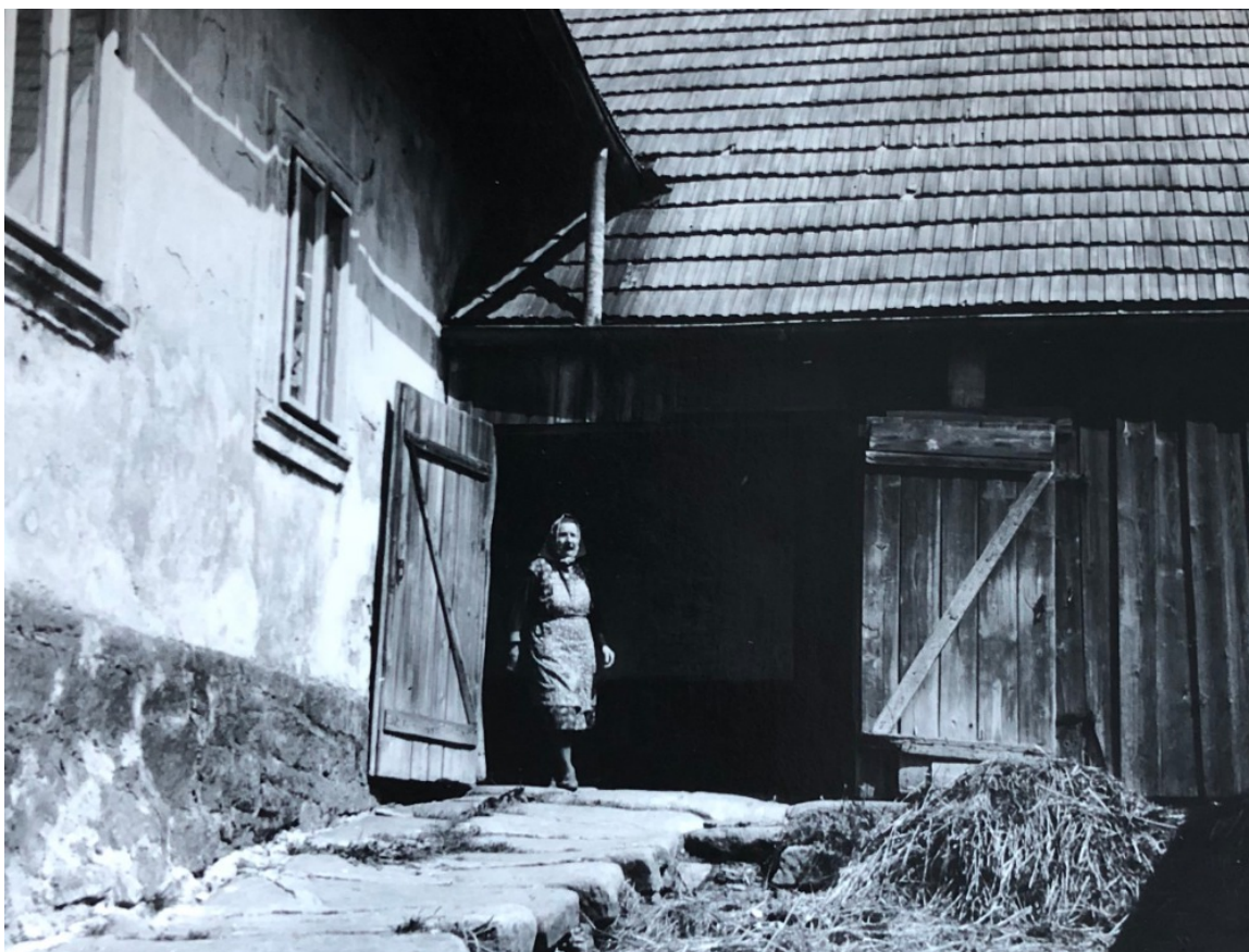
V této stodole se ukřývali utečenci. Na fotografii je maminka Josefa Čermáka.